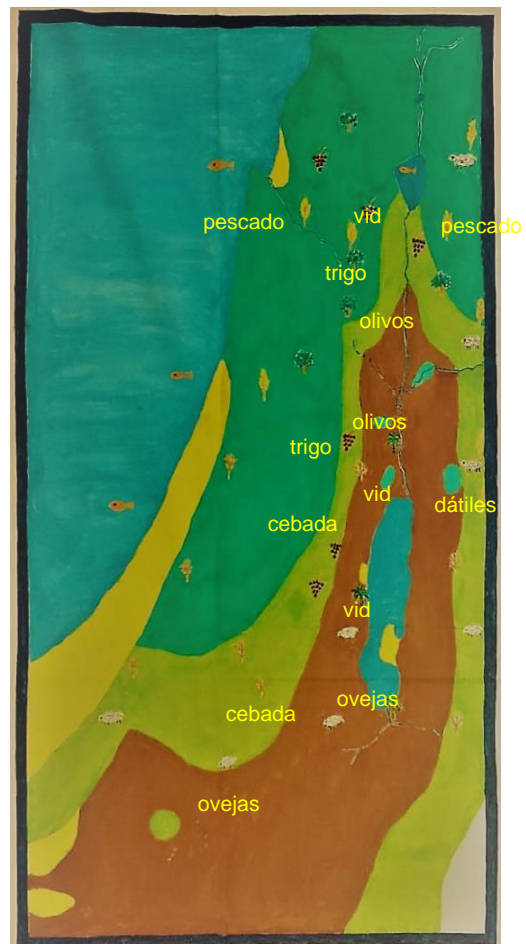
Ilustración 2 Producción