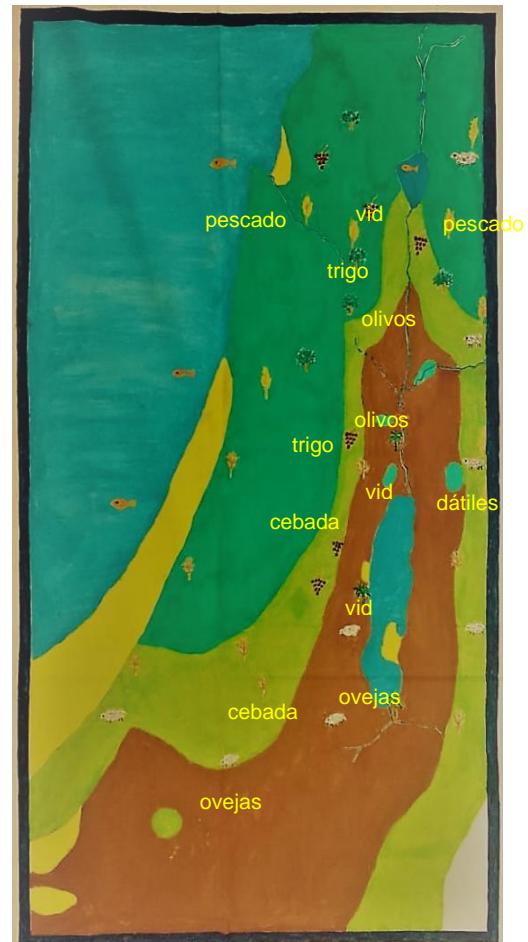
Ilustración 2 Producción