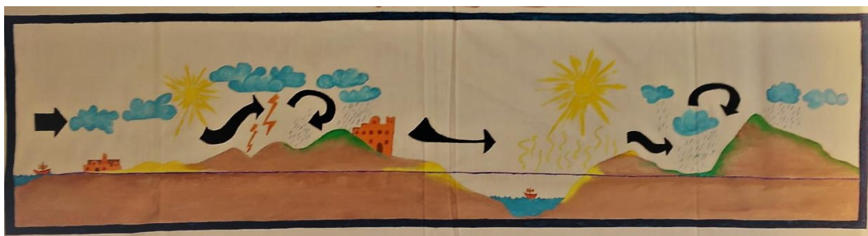
Ilustración 1 Sentido de las lluvias en Palestina